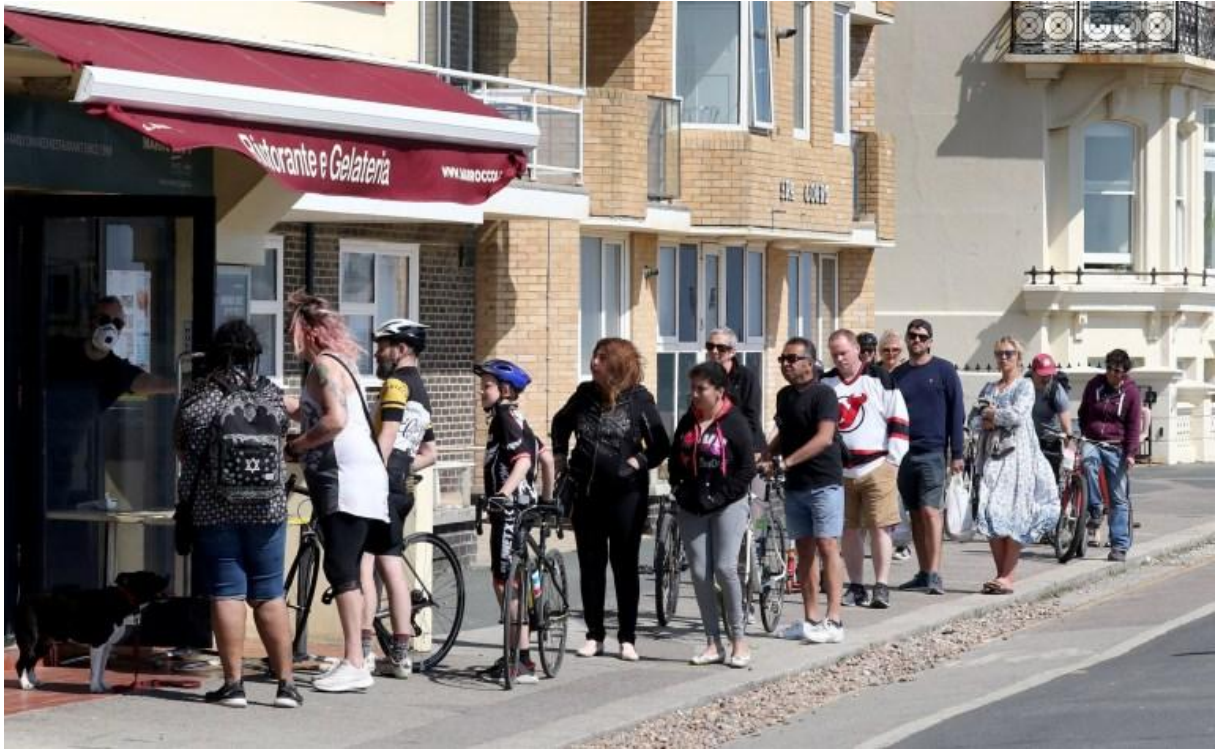
Saturday April 25, 2020. People did not stand two metres apart as they queued up for ice cream from a cafe in Hove, East Sussex