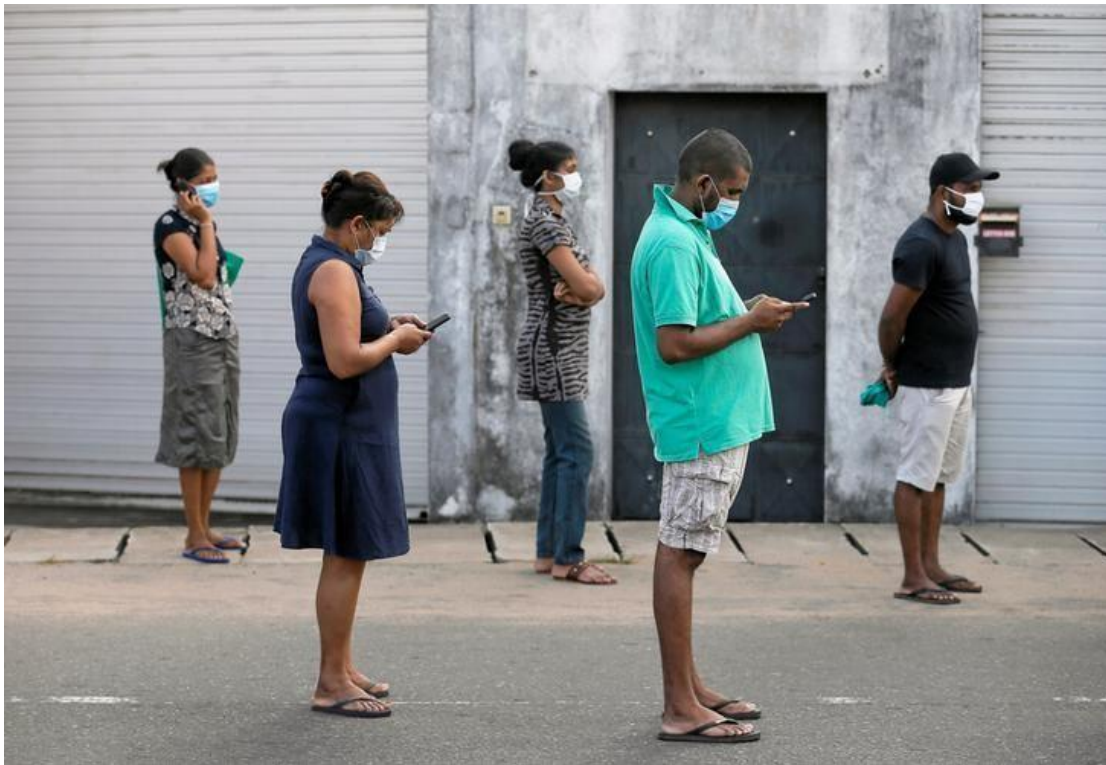
Outdoor space: People stand 1 metre apart as they queue to buy groceries in Colombo, Sri Lanka, during a break in a government-imposed coronavirus curfew.