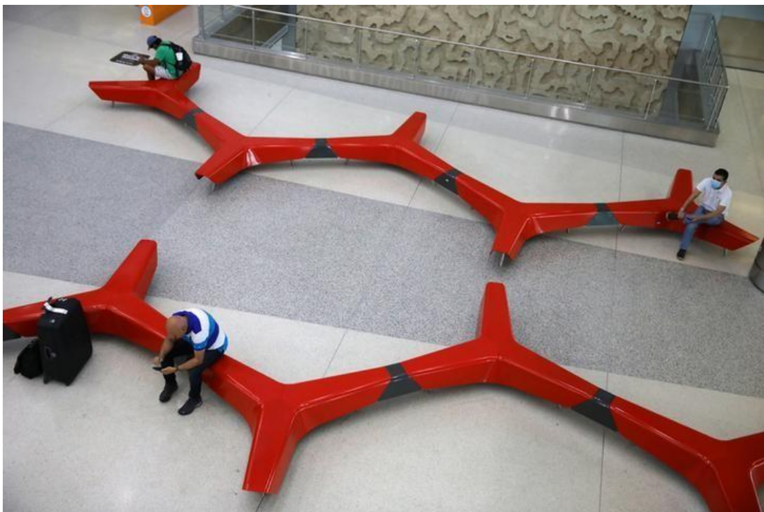
Waiting room: Passengers at Miami International Airport distance from one another after flights to New York were cancelled because of the high number of coronavirus cases in the city.