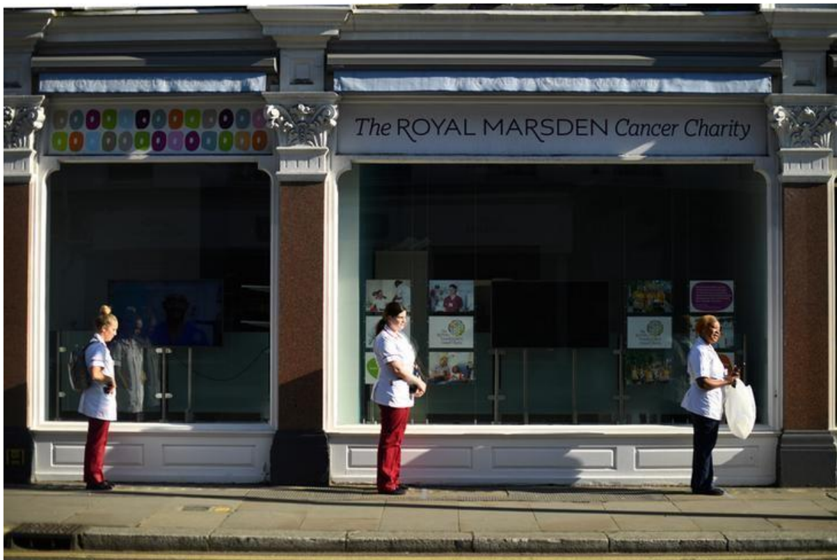
Meals apart: Nurses line up for donated lunches in London, UK.