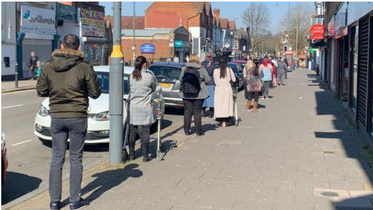
Scene outside Asda in the Kings Heath area of Birmingham UK (ichef.bbc.co.uk)

Devant cet impact du coronavirus : Il va falloir nous armer de patience (Une canne siège trépied ne sera pas de trop pour les jambes fragiles).