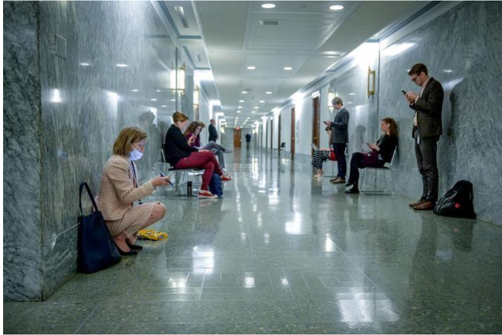
Journalists wait to hear the outcome of a meeting about coronavirus economic aid legislation at the US Congress in Washington DC.