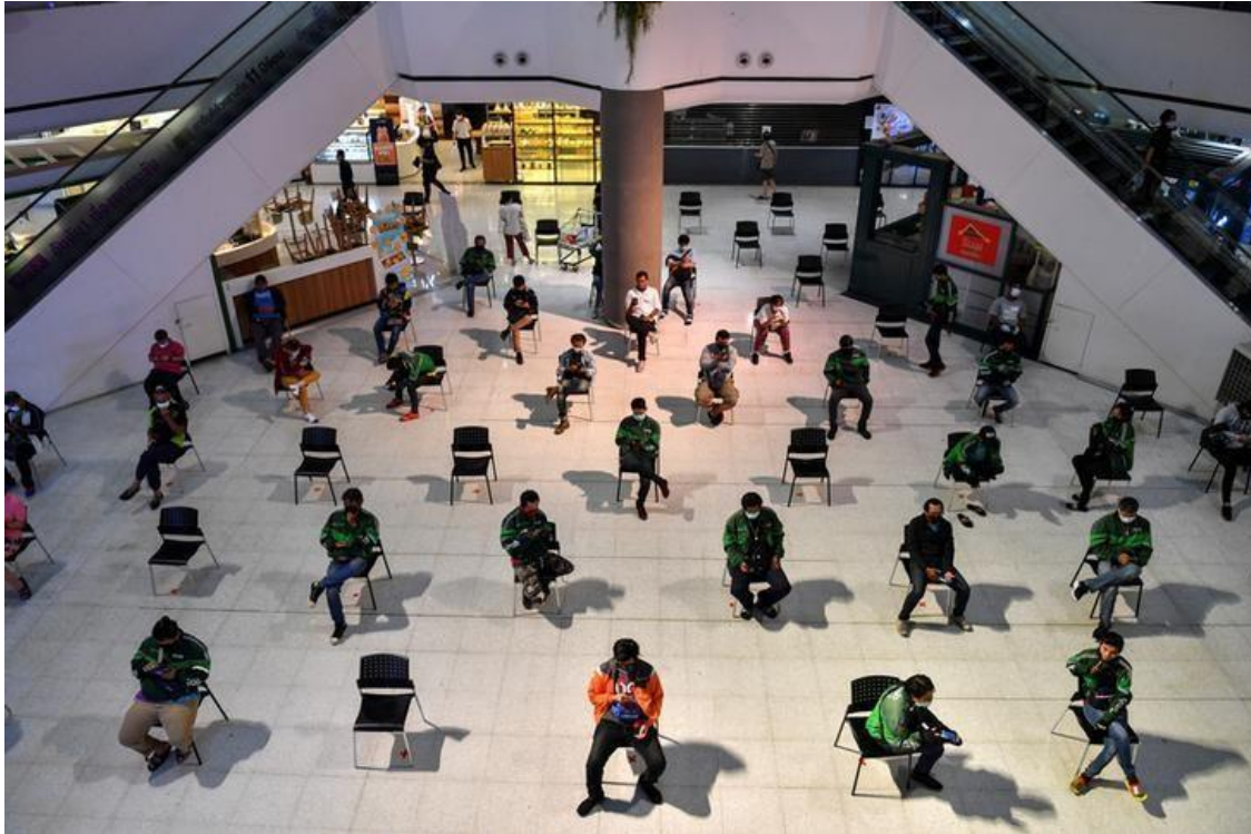
Food to go: Bangkok delivery drivers wait for orders at a food store in Thailand's capital.