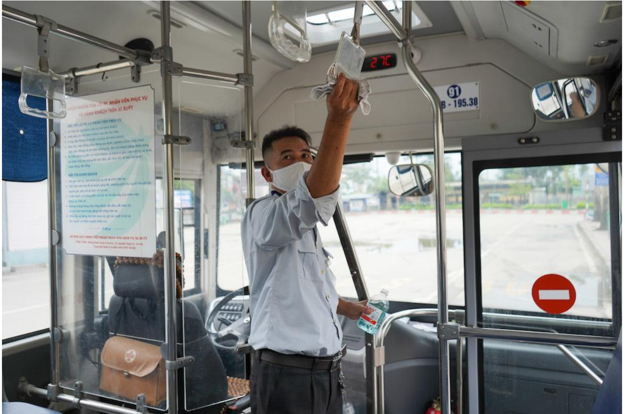
Các tay nắm được các nhân viên trên xe buýt thường xuyên sử dụng nước sát khuẩn để lau khi có khách lên xuống xe.